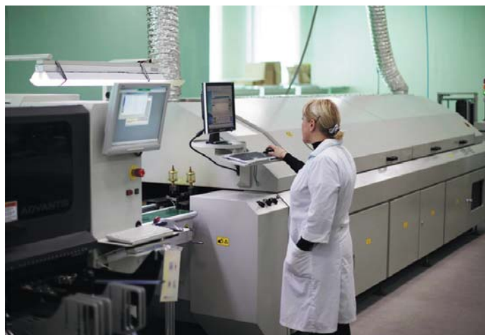
Рис. 2. Производственный потенциал компании позволяет обеспечить полный цикл изготовления светильников

выпускаемых светильников, а служба поддержки и сервиса делает все возможное для удовлетворения запросов клиентов.