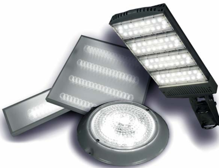
Рис. 3. Производство широкого спектра светильников технического назначения