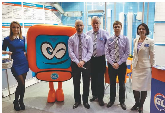
Рис. 1. Компания Good Light — неизменный участник ведущих специализированных выставок в России